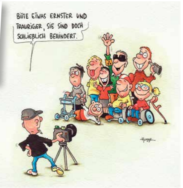
Karikaturen von Phil Hubbe werden auch gezeigt.

derte Cartoons – lachen erlaubt“, Fotografien und Malereien von Multiple-Sklerose-Betroffenen aus Mecklenburg-Vorpommern sowie Bilder von Kindern, die zeigen, wie sie MS sehen. Nach der Ausstellungseröffnung findet im Schleswig-Holstein-Haus ab 14 Uhr ein Hoffest mit Swing-Musik, einem Fachvortrag und Beratung statt. Die Ausstellung ist bis zum 31. Mai im Untergeschoss der Marienplatz-Galerie zu sehen. www.dmsg-mv.de