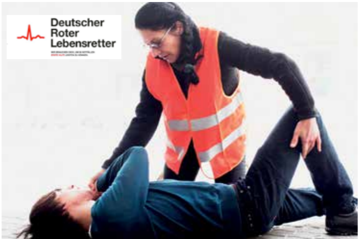
Erste Hilfe, aber richtig – der DRK zeigt, wie's geht.

Nähe, aber jemand anderes schon. Gesundheit verstehen viele als eine eigene Leistung. Das ist es nicht. Es ist eine Gemeinschaftsleistung.“ Zu wissen, was man tun kann, um jemand anderem das Leben zu retten, sei mit das Sinnvollste, was man lernen könne. Aber wirklich falsch