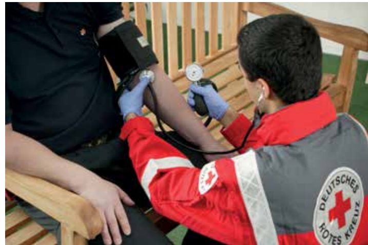
Die Kontrolle des Blutdrucks gehört auch mit zum Programm.

Aktion des Schweriner DRK-Kreisverbandes am 6. Mai in der Marienplatz-Galerie