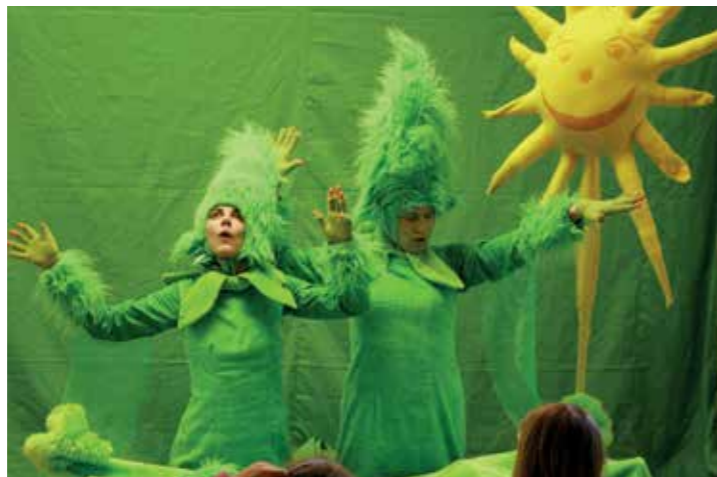
Theater für Kinder steht auch auf dem Plan.

Theater, Live-Musik, ein großes Gewinnspiel und mehr am 29. April