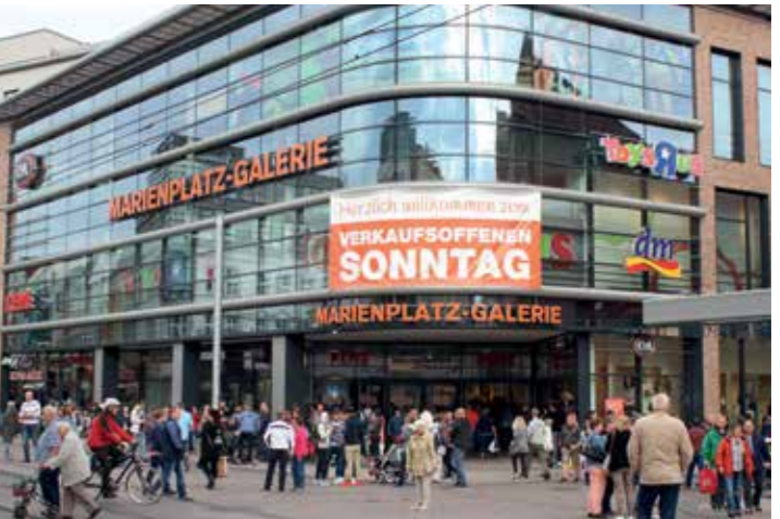
Anziehungspunkt auch am Sonntag: die Marienplatz-Galerie

Wer beim Stress des Alltags in der Woche nicht zum Einkaufen kommt, nutzt gern das Wochenende dazu, in erster Linie natürlich den Sonnabend. Aber auch am Sonntag kann man hin und wieder shoppen; am 30. April ist in der Marienplatz-Galerie der nächste Termin. Das passt diesmal besonders gut, da ja der darauf folgende Montag wegen des Mai-Feiertages als Einkaufstag wegfällt. Die Geschäfte in der Galerie öffnen am 30. April von 13 bis 18 Uhr. Das Besondere an diesem verkaufsoffenen Sonntag: Marco & Friends unterhalten die Besucher live mit fröhlicher Frühlingmusik.